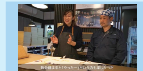
製造業コンサルタント派遣 実際の事例紹介動画