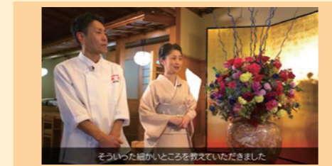
フードコンサルタント派遣 実際の事例紹介動画