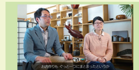
ディスプレイアドバイザー派遣 実際の事例紹介動画